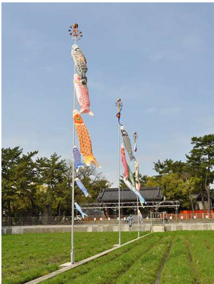
(住吉大社 御田のこいのぼり)