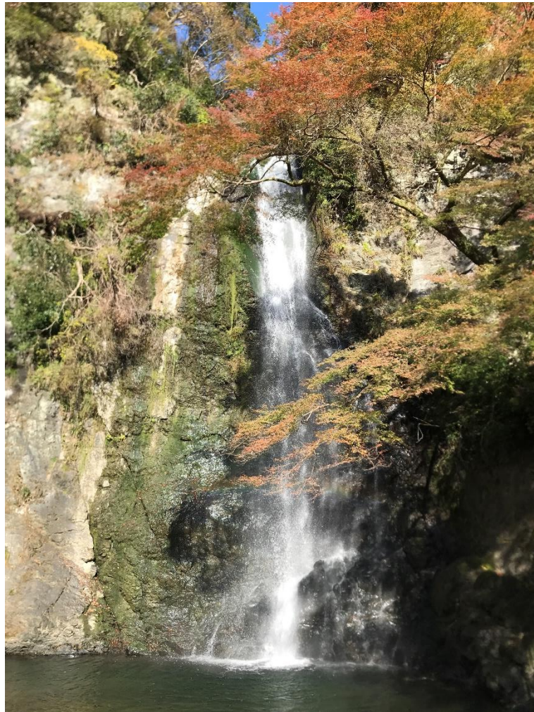
（「箕面大滝」撮影地：大阪府箕面市）