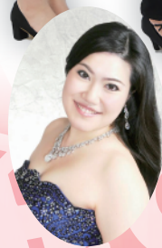
ソプラノ 志水 祐子