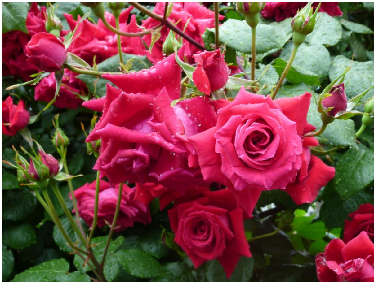
(中之島公園のバラ)