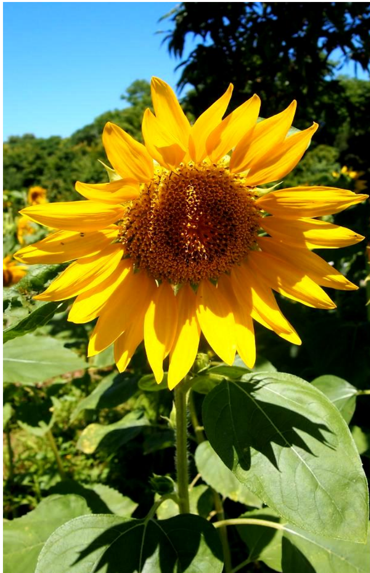
（長居植物園に咲くヒマワリ）