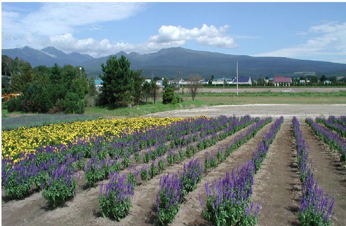
(「富良野のラベンダー畑」(撮影地：北海道 富良野市))