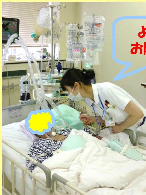
集中治療部の勤務風景